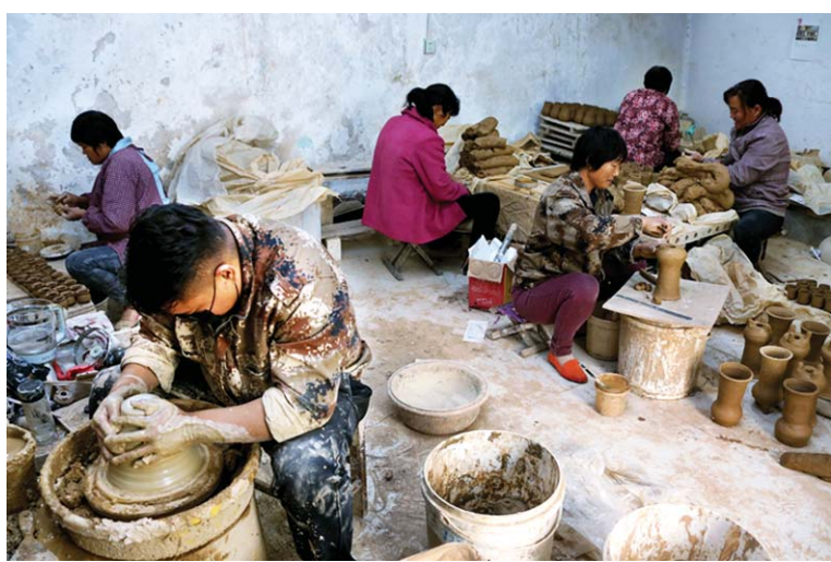
砂陶作坊里，虽然气氛有些沉闷，但每个人做出的产品都必须是精品。