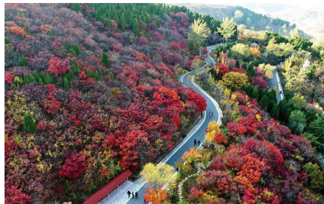
漫山红叶交相辉映，风景如画。