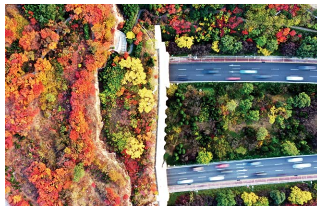
空中俯瞰，济南的隧道仿若“时光隧道”，穿越四季。