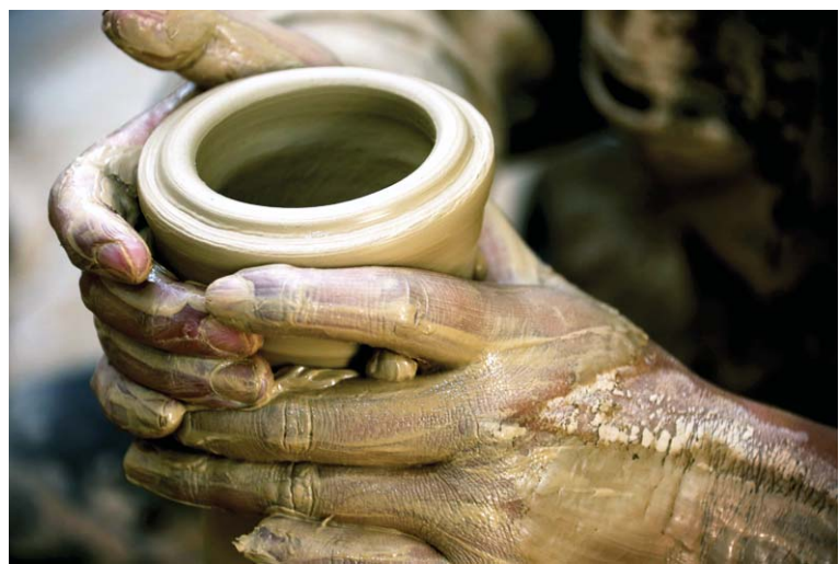
砂陶成型要靠手工，因此即使是同一种产品，每一件都会独具魅力。