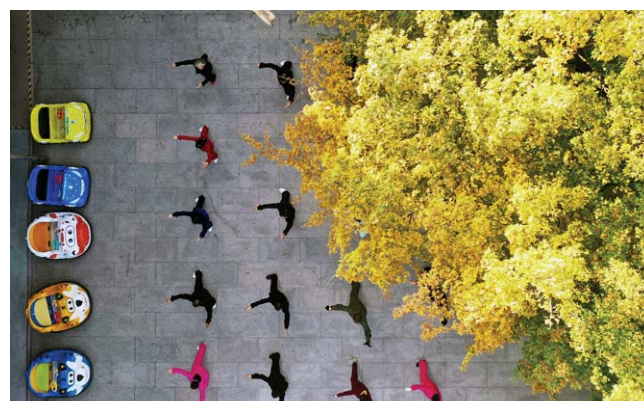
清晨沐浴着秋色，长者悠然舞太极。