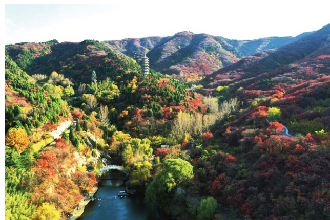
红叶谷景区层林尽染，秋意正浓。