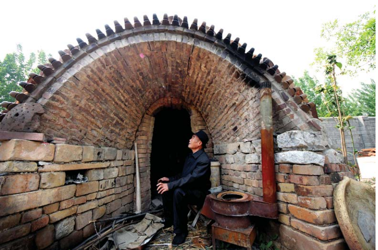
古老的馒头窑如今已成为只能缅怀过去的地方了。