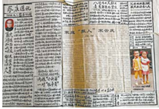
1994年六月的《家庭通讯》