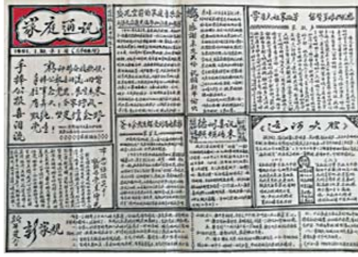
1991年第一期的《家庭通讯》