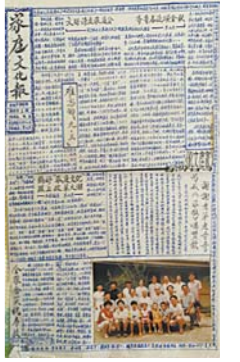
1993年由《家庭通讯》改名后的《家庭文化报》