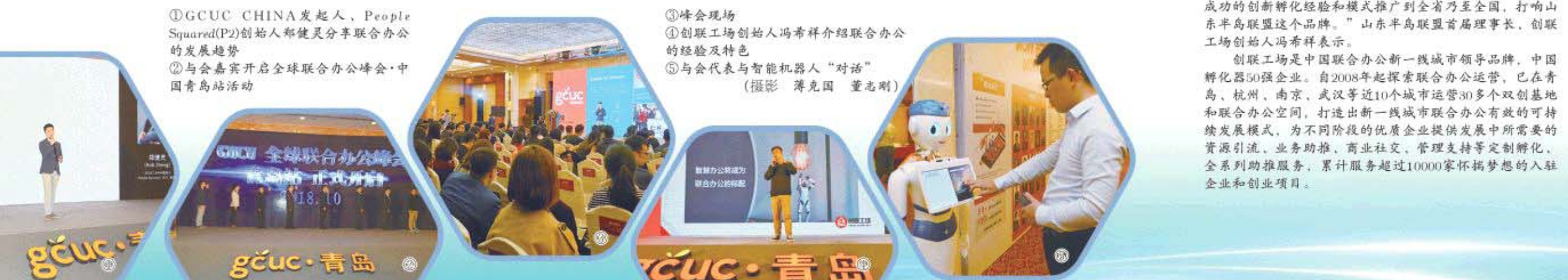
① GCUC CHINA 发起人、People Squared(P2)创始人郑健灵分享联合办公的发展趋势 ② 与会嘉宾开启全球联合办公峰会·中国青岛站活动

创联工场是中国联合办公新一线城市领导品牌，中国孵化器50强企业。自2008年起探索联合办公运营，已在青岛、杭州、南京、武汉等近10个城市运营30多个双创基地和联合办公空间，打造出新一线城市联合办公有效的可持续发展模式，为不同阶段的优质企业提供发展中所需要的资源引流、业务助推、商业社交、管理支持等定制孵化、全系列助推服务，累计服务超过10000家怀揣梦想的入驻企业和创业项目。