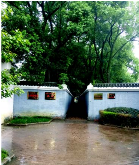
桐城“六尺巷”遗址

劝其隐避。其正色曰：‘举家尽行，人将谓夫子志不固，且吾何忍夫子独危我独安？城陷之日，必死！’张泽国说。