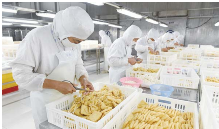
△驰中集团生产车间

突出惠民工程，不断提高群众幸福指数。广饶街道始终把保障和改善民生作为根本出发点和落脚点，做好今年全街道确定实施的10件惠民实事，围绕工作落实度做文章，确保年底前10项惠民实事工作全面完成，真正让群众共享街道经济社会发展成果。提高矛盾纠纷排查的覆盖面和纵深度，切实做好重点敏感时期的信访稳定工作，完成好各项维稳任务。加大安全环保巡查力度，严格落实班子成员带头查安全隐患和专家查隐患机制，对发现的隐患问题坚决查处，确保全街道和谐稳定。