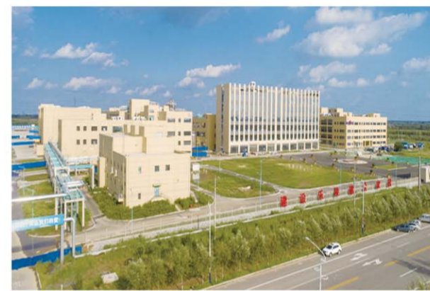
△投资15亿元的齐鲁制药乐陵医药产业园项目

一线现场办公会开进项目工地，催生了“井家现象”，更促进了全市经济社会高质量发展的大提速。南部生态区的3.9万亩核心区百味乐园田园综合体项目，规划已编制完成，种植核桃1000亩、马铃薯550亩、辣椒300亩；马颊河湿地公园、康养一体化、农业废弃物再利用等项目也已全部开工；去年10个棚改安置片区的主体封顶项目接近40%，今年4000套棚改项目全部开工；城区生态水系综合治理、“三馆一书院一厅一中心”、铁营镇工业蓄水、杨安镇污水处理及配套管网4个PPP项目已全部进入财政部项目库；新修公路282.9公里、危桥29座，挺进路东延、枣城大街南延工程、S240乐陵绕城段改建、S248大修工程等重点项目的计划进度都有所提前。今年1—9月份，全市完成固定资产投资165.26亿元，增长7.3%，快于年度预期目标3个百分点。