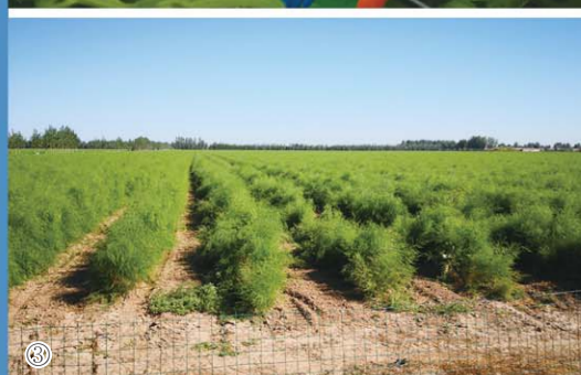
①临邑建设供销社为农服务中心提供全方位农机服务 ②农业工人在凯盛浩丰智慧大棚中工作 ③宿安乡万亩蔬菜基地茶叶种植园