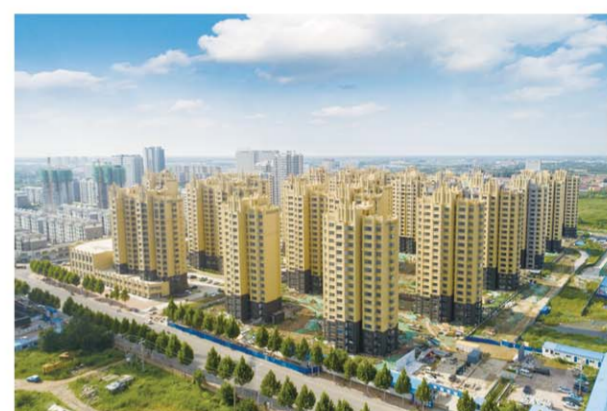
△井家棚户区改造项目现场