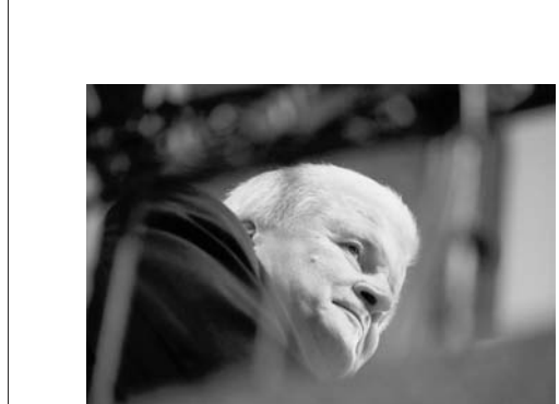
德国内政部长泽霍费尔接受采访。

德国最大州，巴伐利亚州议会选举当地时间14日公布初步结果，长期在该州执政的基督教社会联盟(基社盟)遭遇挫折，得票率降至35%左右，将失去在该州政治主导地位。分析认为，基社盟在巴州的失势将累及其姊妹党，即德国总理默克尔领导的基督教民主联盟(基民盟)。执政联盟稳定性面临考验。