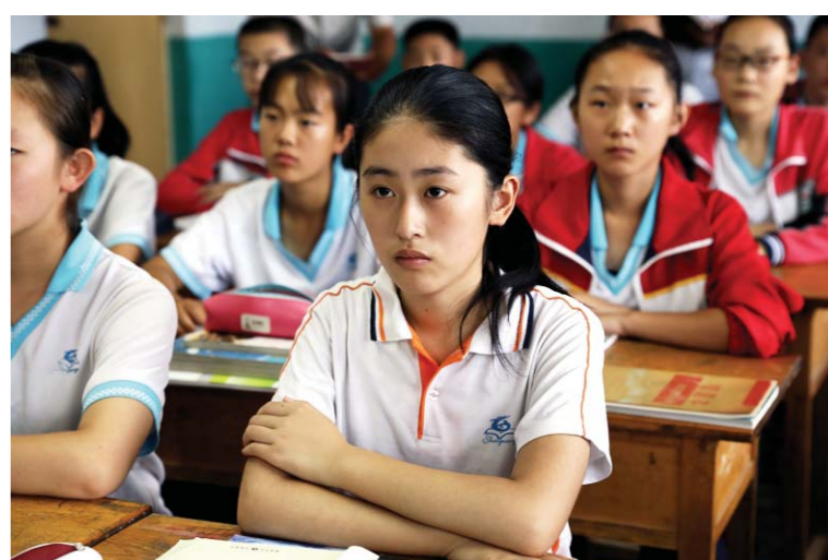
9月3日，寿光市所有受灾中小学均正常开学。当地学生倍加珍惜这次来之不易的“开学”，在课堂上认真听讲。