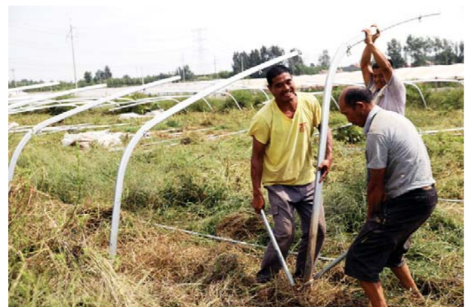
昌乐县白塔原乡农庄，工人们正在拆卸被洪水冲坏的大棚钢架，他们将在原地重建新的高温大棚。

9月3日，寿光市田马初级中学，教师正在给学生上特别的“开学第一课”，鼓励学生们好好学习，自立自强，为父母减负分忧。