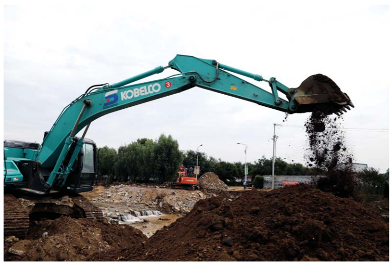
昌乐县丹河一条支流河道的桥梁被洪水冲垮，大型机械正在全力施工，抢修堤坝桥梁。