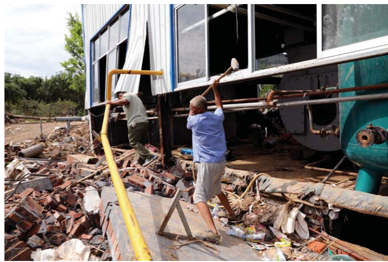
青州市王坟镇金潮来食品公司厂区，工人正用大锤打破被洪水冲塌的墙体，以便找出被墙体压住的电线。