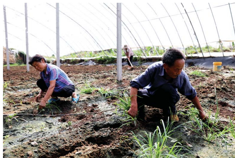
昌乐县鄆都镇一处田园综合体，工人正在过水后的大棚里拔除杂草，准备补种菜苗。