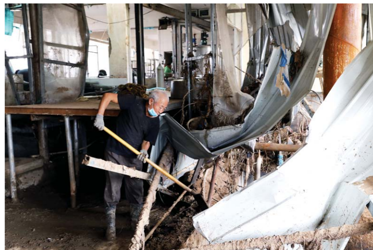
青州市王坟镇一家食品加工企业，工人正在被洪水冲击过的车间里，清理淤泥和杂物。