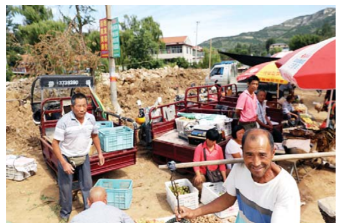
9月5日，青州市王坟镇，位于弥河支流河道边的一处农贸市场已恢复正常营业。洪灾后，各部门第一时间修复灾区通讯交通设施，确保灾区物资供应充足。