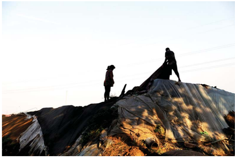
寿光市纪台镇东方东村，菜农正站在被洪水冲塌的大棚上收拾盖布和草帘，大棚重修恢复生产，至少要到明年才能完成。