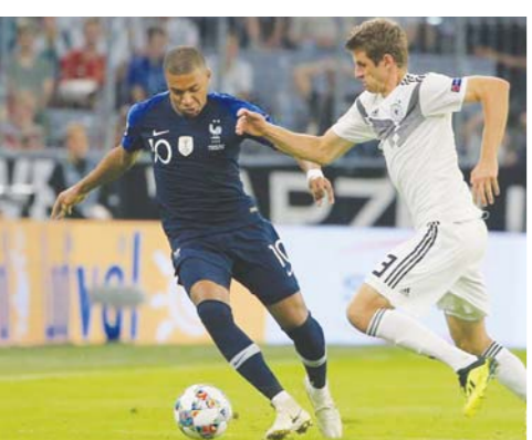
▲德国队球员穆勒(右)与法国队球员姆巴佩在比赛中拼抢。