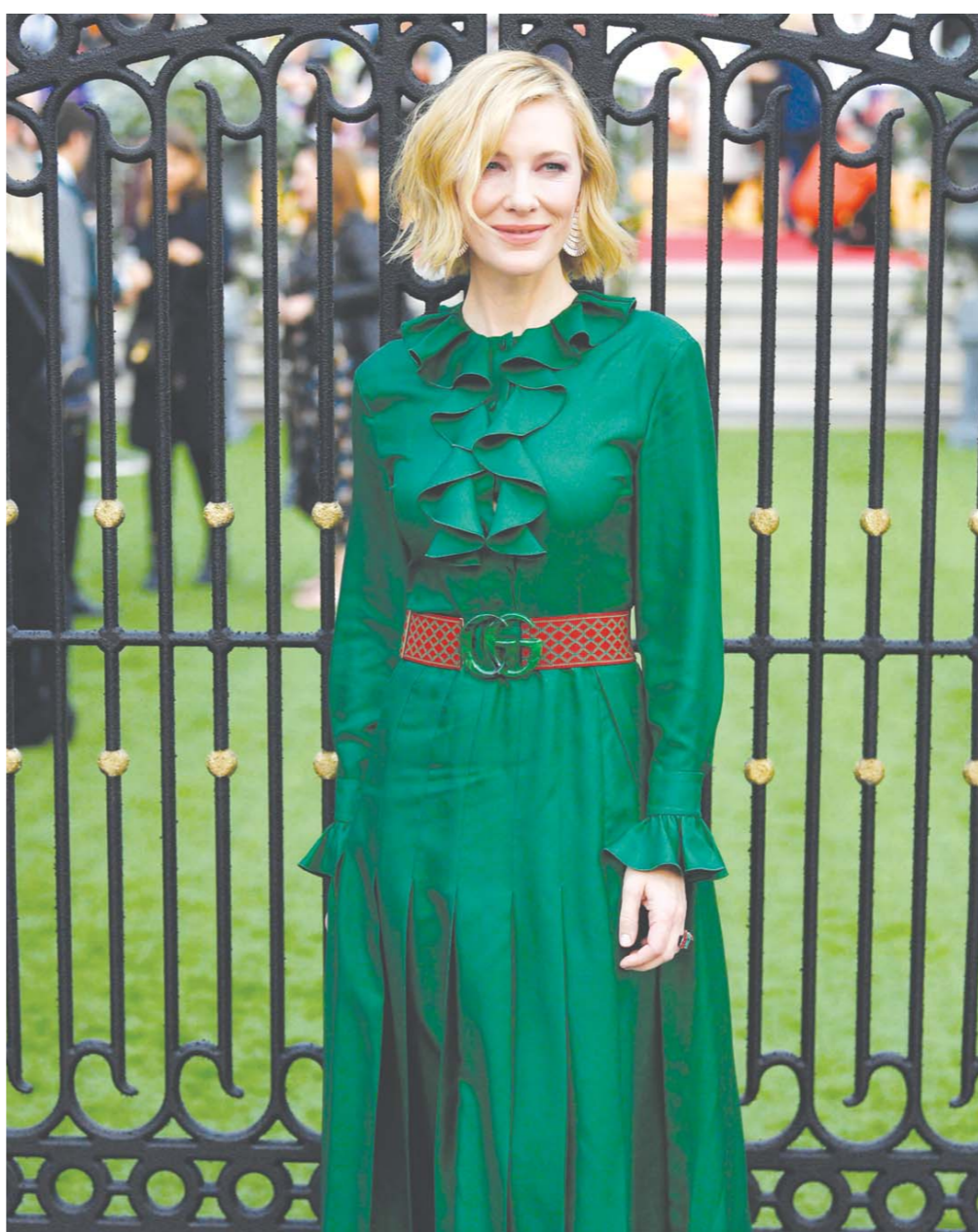
当地时间9月5日，伦敦，凯特·布兰切特出席影片《墙上有一个钟的房子》首映式。

9月6日晚，电影《未择之路》在北京举办首映礼。《未择之路》将于9月14日在全国上映。