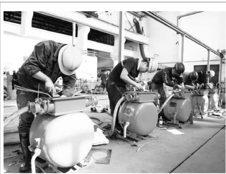
充分调动广大职工学技术、比技能和岗位练兵的积极性和主动性,掀起“比学赶超”的热潮,9月1日,山东能源临矿集团菏泽煤电第二届职业技能竞赛鸣锣开赛,来自该公司11个专业的300余名参赛选手将展开为期两个月的激烈角逐,最终决出各专业前三名入选公司人才库。(郭浩 杨以龙 王泉麟)

严把服务监督,保障优化营商环境成果。打造内部“三全”监督体系,以“纵向到底,横向到边,垂直到端”为思路,实现“全方位覆盖”“全过程管控”“全天候监督”的立体监督格局。通过实施“红、黄、绿”三色监督回访卡制度,实现客户对服务过程的实时监督、主动监督、整体监督,提高服务风险防控水平,达到“不敢腐、不能腐、不想腐”的效果。