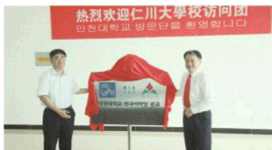
△仁川大学韩国语学堂揭牌