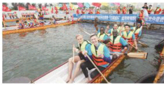
△留学生参加龙舟赛