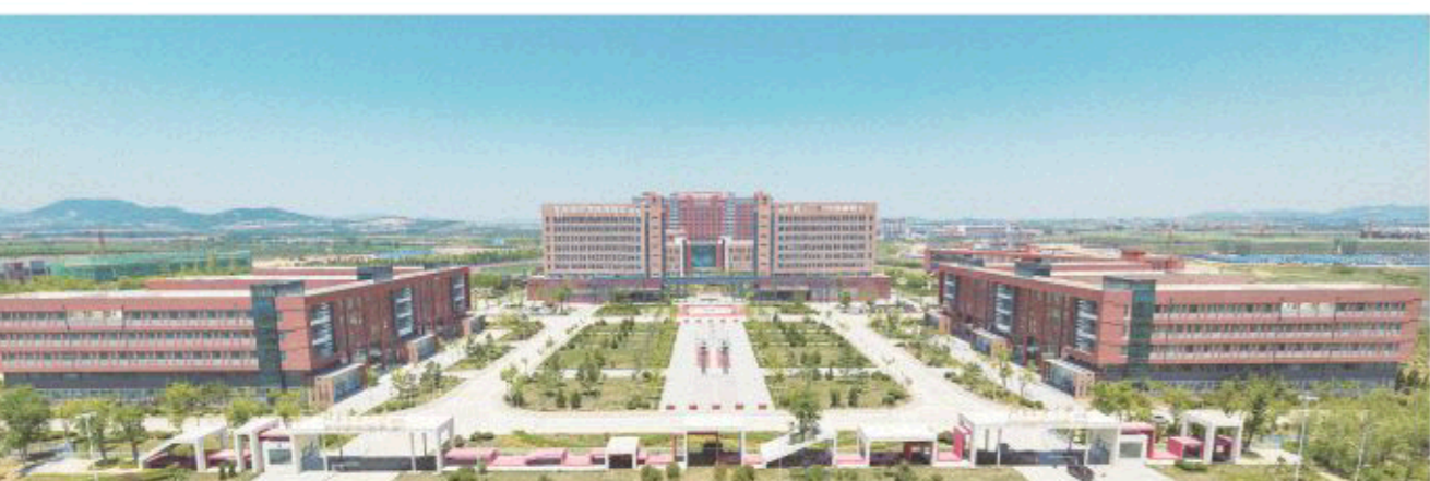
△北京交通大学(威海)