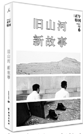
《正午6：旧山河，新故事》 正午故事 著 台海出版社

作者认为，财富创造力的发挥，取决于一国的制度品质，包括产权保护体系、契约执行体系以及保障市场交易安全的其他制度。可以说：制度的品质，决定财富创造力的