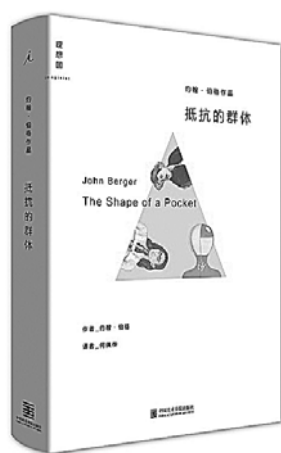
《抵抗的群体》 [英] 约翰·伯格 著 中国美术学院出版社

艺术可以在艺术家和他(她)在画布上再现的对象之间，或者是在艺术的爱好者和一幅画作之间，亦或者是读者和伯格的文章之间建立抵抗的关系。这个特别的书名，指的就是这种抵抗组成的一个“群体”。抵抗的对象是什么？从作者立场来说，那就是当下这个几乎被普遍资本主义化了的世界。