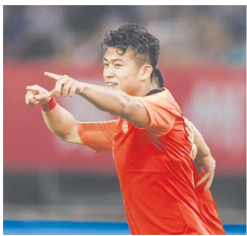
▲中国队球员张玉宁在比赛中庆祝。