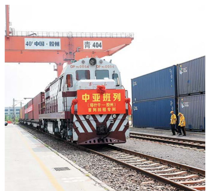
8月8日上午,首列中亚(塔什干—胶州)回程班列抵达上合示范区青岛多式联运中心。