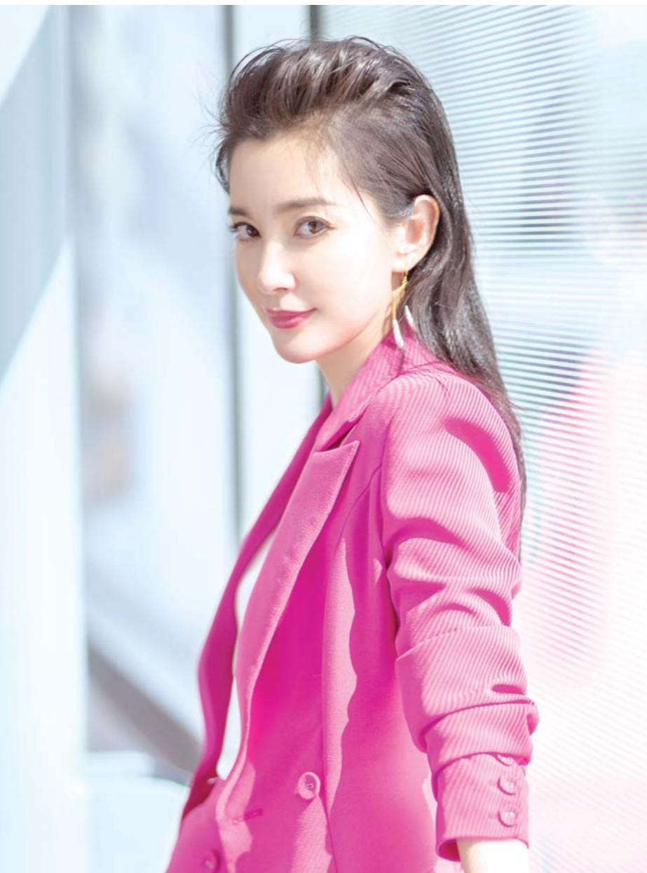
当地时间7月28日，美国洛杉矶，中国女演员李冰冰与好莱坞男星杰森·斯坦森出席新片《巨齿鲨》首场记者会。李冰冰在片中出演中国科学家。图为李冰冰现场拍摄写真。

王智量先生在节目里说：“我们每一个人都有一个母亲，要是对母亲不好，你就不配做人。”对母亲好，就是听母亲的话，做个有童心、有良心的人，做个追求完美的好人。