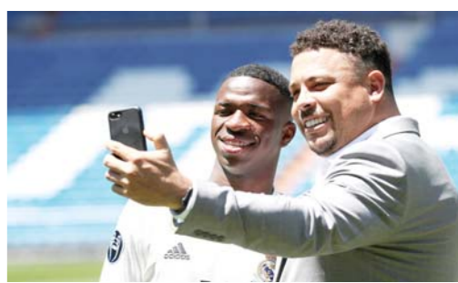
维尼修斯·儒尼奥尔亮相皇马 当地时间7月21日，新近加盟西甲皇家马德里队的巴西新秀维尼修斯·儒尼奥尔亮相西班牙马德里伯纳乌球场。图为维尼修斯·儒尼奥尔（左）与皇马球员罗纳尔多自拍合影。