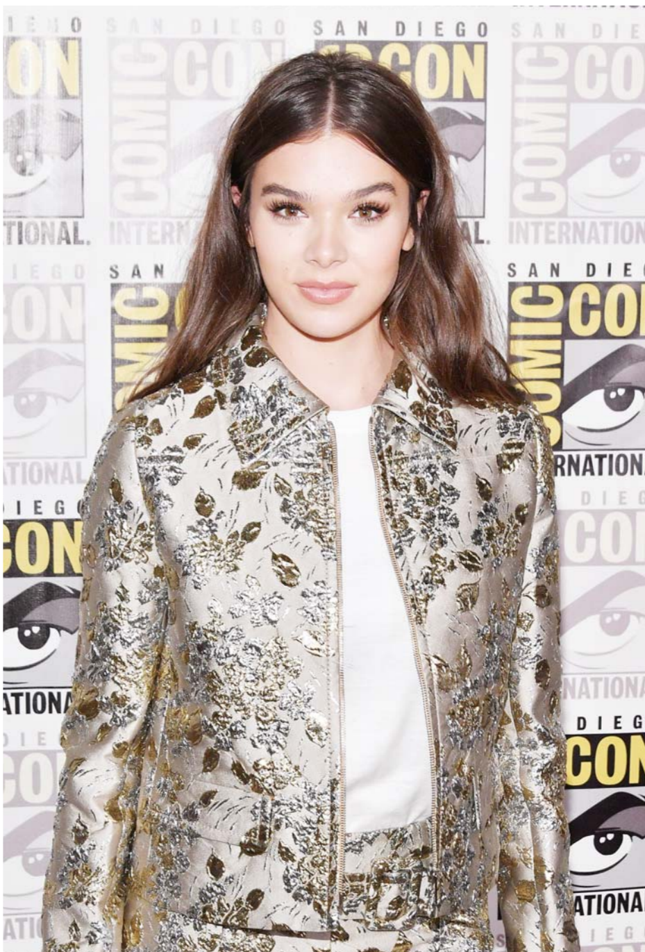
当地时间7月20日，美国圣迭戈，科幻电影《大黄蜂》亮相2018圣迭戈国际动漫展并举行发布会，主演海莉·斯坦菲尔德现身。

影片后半段，丹的母亲不顾一切从乡下赶来，阻止儿子飞蛾扑火般的付出——可在和女孩儿母亲的几句交流后，她落泪走了。在古老的土地上，那种醇厚的人际温暖她们其实都懂，母亲的选择，仿佛重新让人看到那些遗落的、可贵的情感连接。 《十月》属于印度电影中最不强力叙事的一派。虽然出现了生命重创与消逝，但它更像一个入口，开启世间种种最真实的心境。不煽情的沉默，让情感得以慢慢地自生、自展，带出的气质既不浪漫，也不奇迹，只是恳切。它身上有爱情电影的影子，可又明明是属于印度人间的叙事。它蕴着悲欢与酸甜，把滋味调和的不是那么凄怆。结尾处，丹坐在雇来的小货车斗中，用力用手稳定住女孩儿的遗物夜茉莉，身躯和花干一起随着车子轻轻摇晃，远处天色将亮，一切在光明与晨雾之间。