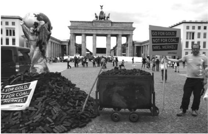
□李文明 报道 在柏林勃兰登堡门前的广场,一块牌子上写着:德国要世界杯冠军,不要燃煤第一。环保志愿者以这样的方式宣传环保。

康朴公司负责接待工作的莎莎告诉我,1648年西班牙国王菲利普四世在明斯特签订《明斯特条约》,停止了长达80年的荷兰北方省反抗西班牙引发的战争。这些路就是那个年代修筑的,路面有些崎岖不平,但明斯特人从来没有嫌弃它,更没有将它挖掉重建。明斯特