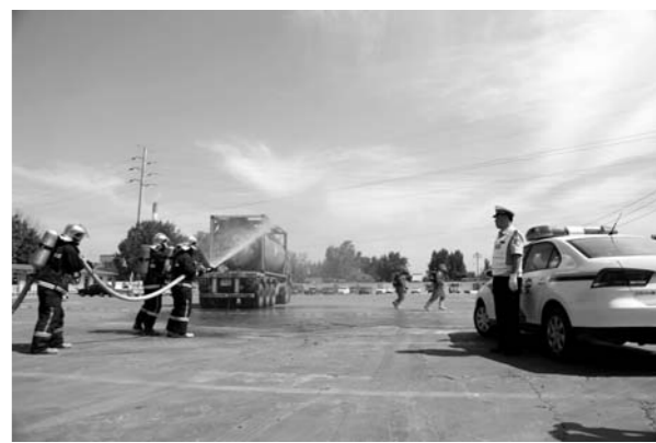
□通讯员 杨丽 崔洋 报道 为进一步规范和加强全区危险化学品运输车辆交通事故应急处置工作,完善应急处置联动协作机制,提高应急队伍的快速反应能力和应急处置能力,6月27日上午,淄博市公安局交通警察支队张店大队联合多部门开展了危险化学品运输车辆交通事故应急救援演练。