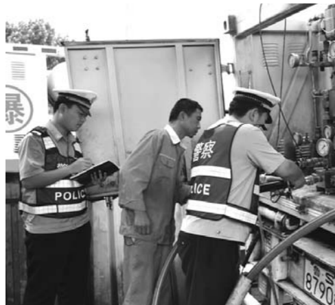
□通讯员 张泽文 报道

随着夏季到来,受高温天气及汛期影响,雨天路面湿滑,对危化品运输安全影响较为突出,交通安全风险增大。近日,莱芜交警紧盯源头管理关键环节,联合相关部门开展安全隐患大排查活动,围绕重点领域、重点行业,组织民警深入14家危化品运输企业,对249辆危化品运输车,通过“以车找人”或“以人找车”的办法,进行“拉网式”再排查,重点检查动态监控制度落实情况,车辆卫星定位装置安装、在线、故障情况,强化对重点管理对象的常态化、户籍化管理。同时,充分利用“两客一危”动态监控平台,加大对危化品车辆运输介质、行驶路线、时间、速度、动态及违法状态等全天候、全时空、实时动态监管,拧紧“安全阀”。