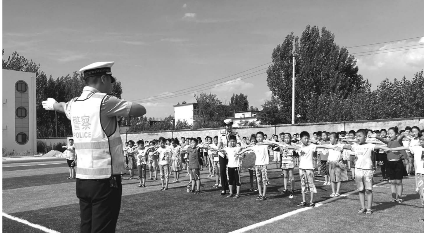
□通讯员 孔翠玲 李凡红 报道

排查中,民警首先向企业通报了近期货物运输车辆道路交通事故案例,详细检查了企业安全管理工作台账,并对车辆的安全设施配置、安全技术性能、安全运营资质和驾驶人的驾驶资质情况进行细致检查,做到及时隐患清零,杜绝存在隐患车辆上路行驶。同时,对驾驶人进行交通安全宣传教育,提高驾驶人安全驾驶文明出行意识,从源头上彻底消除道路安全隐患。