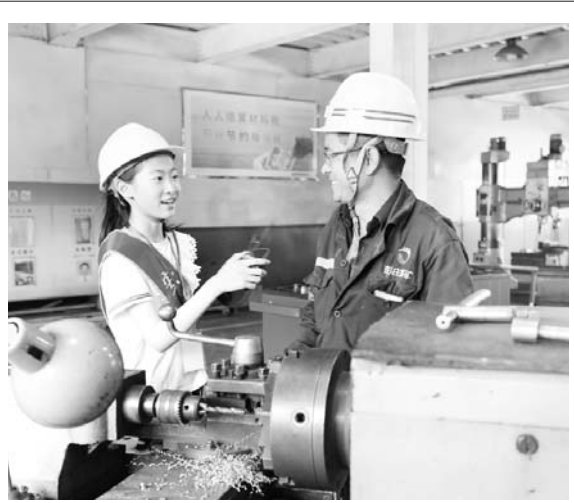
近日,山东能源临矿集团彭庄煤矿组织开展“我是安全小记者”活动。孩子们纯真无邪的问候、天真烂漫的笑容触动了职工坚守安全的心,同时活动也在小朋友心中埋下一颗安全的种子。(明月 庆玉 泉麟)

突出“活”字抓创新,着力提升党建工作价值。创新打造“六个引领”党建新格局,即党建工作重点围绕