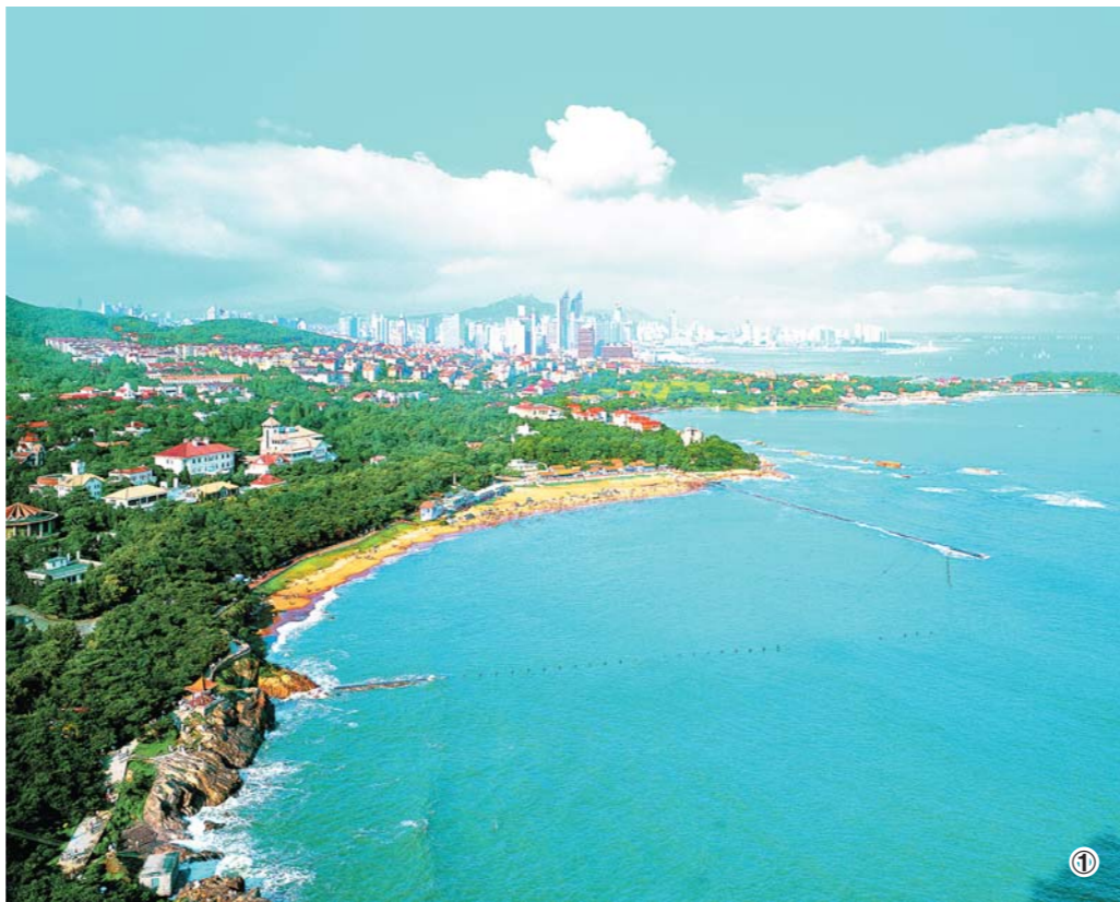
图①：作为我国首批沿海开放城市，青岛的对外开放程度越来越高。（资料图）

中欧、中亚班列是我省连接“一带一路”沿线国家的重要纽带。积极参与“一带一路”建设，全省有9个市开通了“欧亚班列”，累计开行班次500列，形成了东连日韩、西接中亚及欧洲的国际海陆大通道。下一步，我省将统筹全省“欧亚班列”，优化班列路线，提高线路覆盖面，建立健全信息平台，定期发布相关信息；推动省内进出口骨干企业、已经“走出去”企业和物流企业合作建设海外仓，加强与“一带一路”沿线国家合作和设施建设。