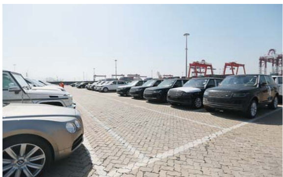
青岛前湾保税港区汽车整车进口口岸停放的进口汽车。

当前，站在新的历史起点，山东正努力实现新一轮高水平对外开放的新突破，推动形成全面开放新格局、新高地。在开放的大潮中，全省上下不忘初心，砥砺前行，奋力交出优异答卷。