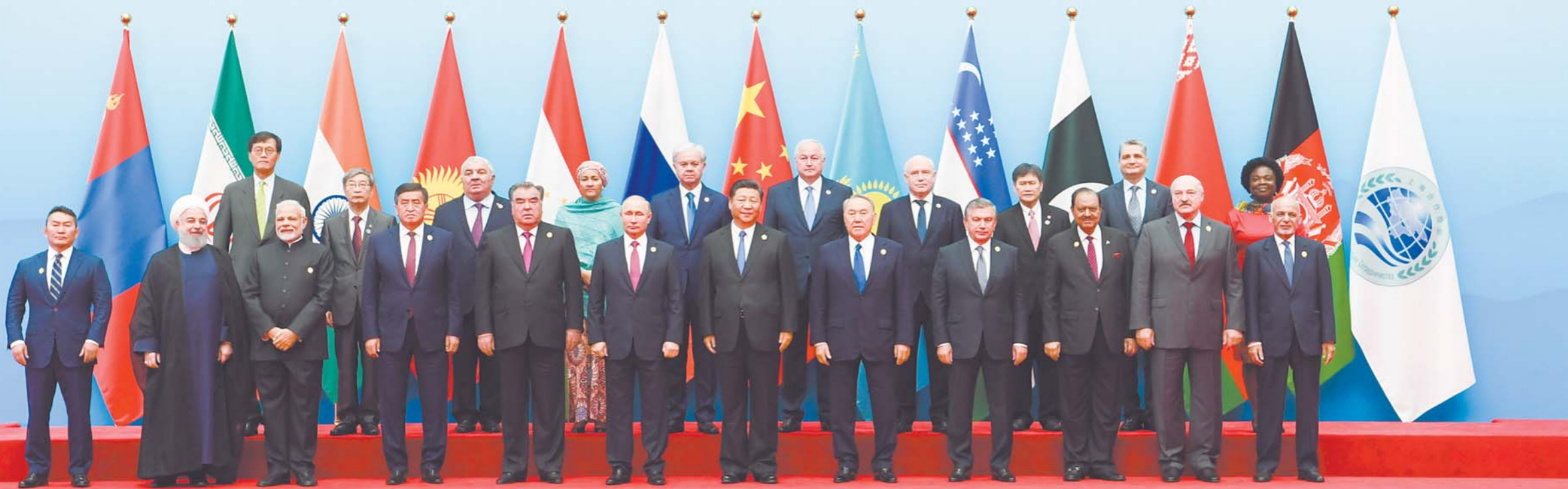
6月10日,上海合作组织成员国元首理事会第十八次会议在青岛国际会议中心举行。国家主席习近平主持会议并发表重要讲话。这是会前,习近平同与会各方在迎宾馆集体合影。

2018年6月9-10日 中国·青岛 9-10 ИЮНЯ 2018 Г. ЦИНДАО КИТАЙ