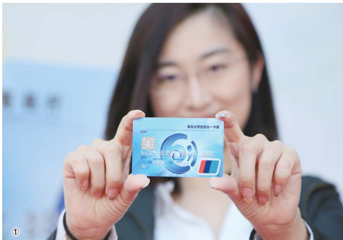
图①：为缓解大学生创业“融资难、融资贵、融资少、融资慢”难题，青岛推出“大学生创业一卡通”，助创业者一臂之力。（□记者 薄克国 报道）

如果说机构改革是“硬件”，审批服务便民化就是“软件”的升级。坚持走在前列目标定位，我省对标世