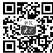
全文见 新锐大众客户端

党的十八大以来,我国生态文明建设取得显著成就,生态环境质量持续改善,美丽中国建设日新月异。党的十八大以来我国生态文明建设成就综述