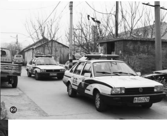
图②：鱼台执行局执行团队赶赴被执行人家中。