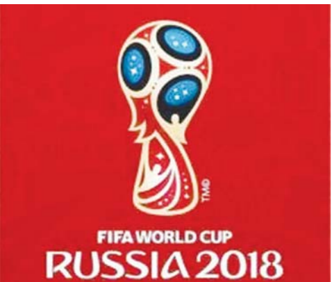
□ 本报记者 王磊

距离俄罗斯世界杯开幕还有30天时间,按照国际足联规定,世界杯32强需要在5月14日公布自己的初选名单。然而,很多球队都选择了延期公布,其中不乏世界杯冠军德国队、法国队、西班牙队。其实,推迟公布初选名单,并非是他们“耍大牌”,而是遇到了各种问题。