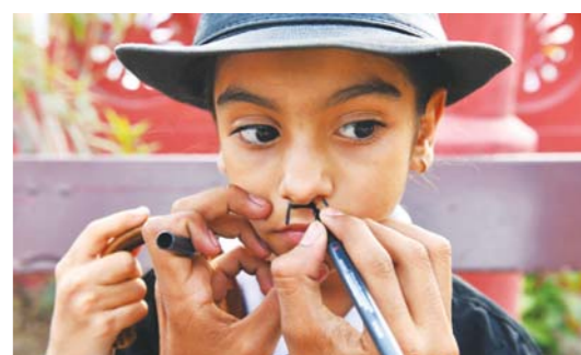
当地时间4月16日，在印度阿迪布小城镇，一名粉丝在化妆。黑色高礼帽、一撮小胡子、一根手杖，数百名粉丝16日以查理·卓别林的经典银幕造型聚集，纪念这位喜剧大师诞辰129周年。

奥尔松今年开始作为欧洲联赛的代表在欧足联执委会中任职。他说：“我们没准备在2022年世界杯期间改变原定的时间安排。我们已经做出让步并同意卡塔尔世界杯在冬季举行，所以我们不同意再延长比赛时间。”