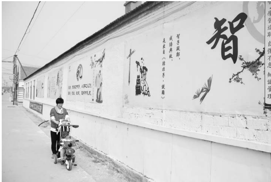
文登区侯家镇东康村将传统文化上墙引导村风焕然一新。