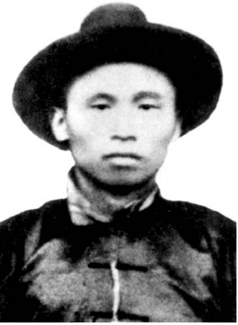
图为林祥谦像(资料照片)。