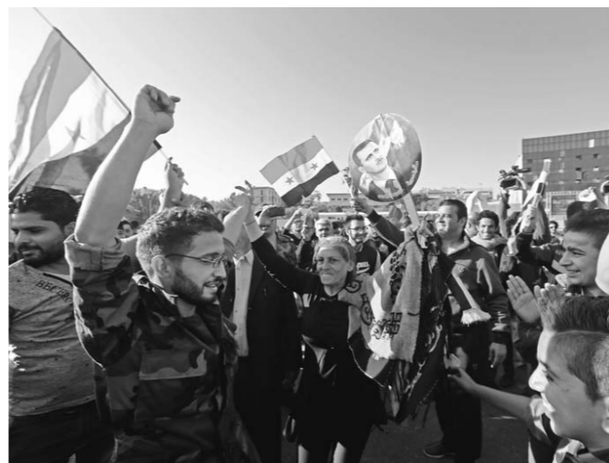
叙民众手持国旗参加谴责美英法的集会。 □新华社发