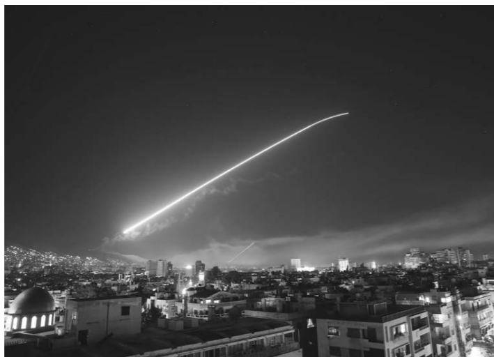
遭受袭击的叙利亚首都大马士革。