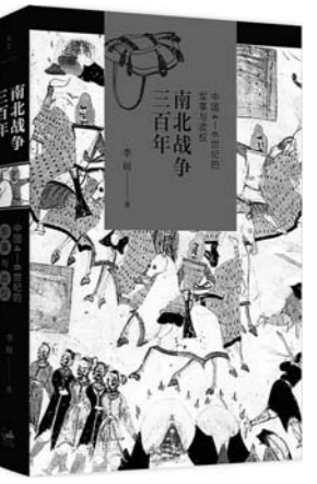
《南北战争三百年》 李硕 著 上海人民出版社

上古的文明是什么样子的？城市的出现，铁器的发明，希腊的崛起，王者的归来，共和的力量，人性的凸显……本书是一部关于西方古代文明的简史。讲述了浩瀚文明的史诗典故，以及那一座座塑造了今日你我的都邑城垣。