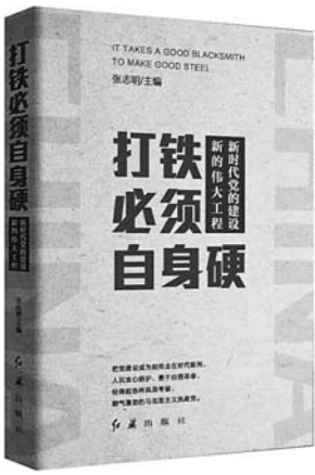
《打铁必须自身硬》 张志明 著 红旗出版社

我们通常对古代战争的想象都源自演义、小说等文学作品，真实的历史情况是如何的？冷兵器时代的战争究竟是怎么打的？该书对各种史料进行分析与整理，从散落史书各处的战争叙述中寻找线索，借助最新的史学研究成果，为我们描绘出了魏晋南北朝各场重大战役细节，展现出丰富、生动的历史原貌。