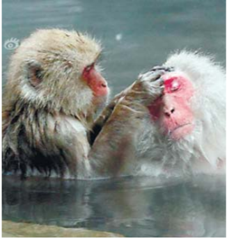
日本猕猴泡露天温泉 表情分外享受

位于印度的“团结雕像”的高度将达到约600英尺(182米),其高度几乎是自由女神像高度的两倍。“团结雕像”旨在纪念20世纪初期印度独立运动的主要领导人之一帕特尔,他被称为“印度铁人”。