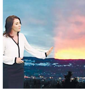
加拿大出现 “阴天” 景象

日本长野县山之内,在当地的“地狱谷”猴子公园,日本猕猴在山间露天温泉中泡澡取暖,表情分外享受。