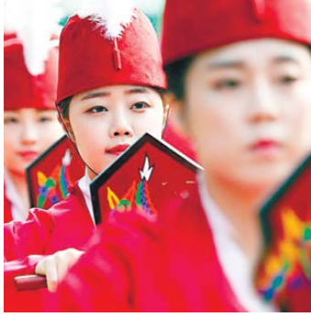
韩国举行春季释奠礼 祭官着古装祭孔

韩国首尔，纪念大成至圣先师孔子的春季释奠礼在成均馆大成殿前举办。在古代，祭孔活动被称为“释奠礼”。