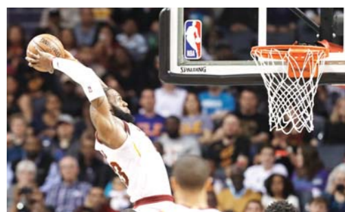
□ 新华社/美联 北京时间3月30日，骑士队球员詹姆斯在与黄蜂队的比赛中扣篮。

据新华社华盛顿3月28日电 美职篮(NBA)克利夫兰骑士队球星詹姆斯在28日进行的对阵夏洛特黄蜂队的比赛中独揽41分，帮助球队在客场以118:105击败对手，这场比赛是詹姆斯连续第866场比赛得分上双，从而追平了篮球传奇巨星乔丹此前创造的历史最好纪录。有意思的是，乔丹目前恰好是夏洛特黄蜂队的老板。