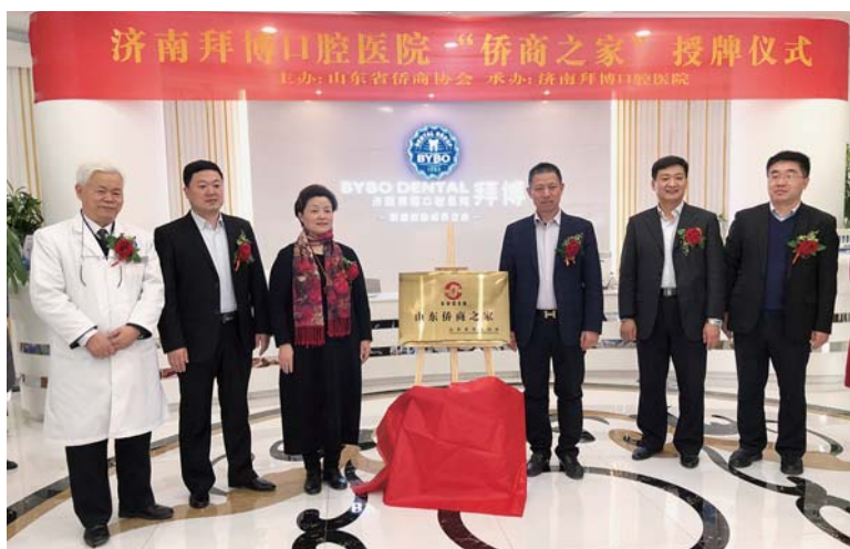
△济南拜博口腔医院被山东省侨商协会授予“侨商之家”