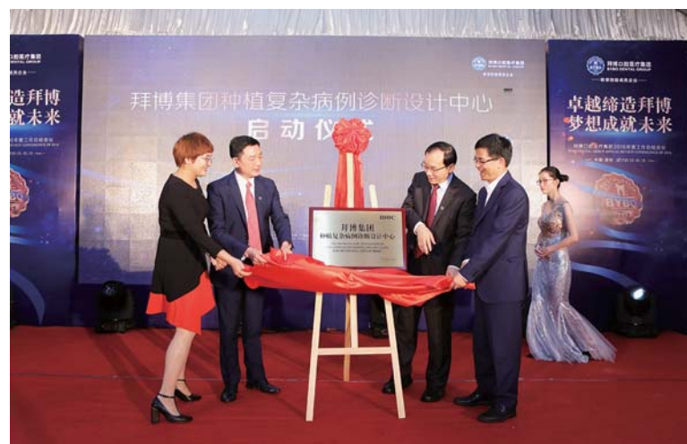
△拜博集团种植复杂病例诊断设计中心启动仪式

提升医疗质量，锤炼学术底蕴，意在培育一个“医者仁心，精益求精”的临床实体。拜博集团一直采取“筑巢引凤”的形式引进学