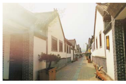
△上高庄园仿古四合院