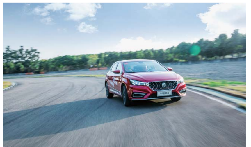
△全新名爵6赛道测试