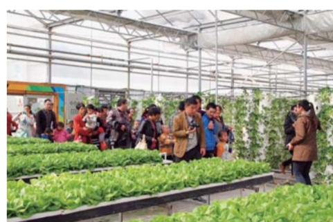
△泰山花样年华未来田园