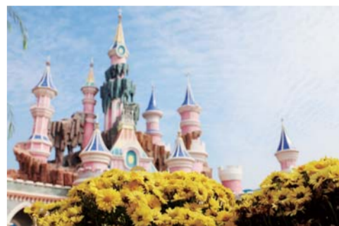
△泰安方特欢乐世界

按照泰山区一盘棋和因地制宜的要求，泰山区旅游发展突出打造“乐山乐水——绿橙红黄”六大亮点，提升亮化“两横四纵”战略布局，全力推进全区全域旅游发展。两横：仁者乐山，以环山路为主线休憩带，打造高端度假、城市民宿产品；智者乐水，依托大汶河湿地资源打造滨水休闲旅游产品。四纵：生态绿，依托济泰高速沿途乡村旅游资源，打造美丽乡村产品；欢乐橙，依托博阳路旅游大道景区景点，打造功能复合型观光体验深度游产品；中国红，依托泰城历史文化轴，打造泰山文化体验游产品；城市蓝，依托时代发展线以万达泰安城市会客厅为统领，打造城市旅游新业态产品。