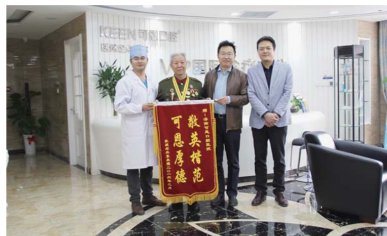
△90岁抗战老兵种牙送锦旗