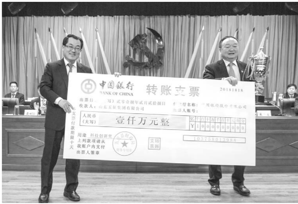
五征集团获颁1000万元科技创新专项奖励。

新旧动能转换,企业是主体,项目是抓手。去年4月,省委省政府提出启动新旧动能转换工程,五莲县迅速开展“对标先进、绿色发展、五莲先行”三年突破行动,理清动能转换、绿色发展的突破路径,集智聚力发展“四新”经济。一年来,投资50.2亿元实施过千万元技改项目100个,新增省级创新项目65个,招引推进了白鹭湾科技金融小镇、海尔硬创智慧产业园、华斯特林机、新能源汽车等40