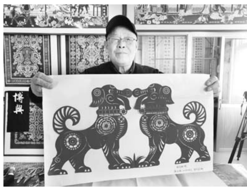
△滨州无棣县北关社区老年公寓歌咏队作品

一场民俗才艺大赛，激起了老人们的艺术情怀。活动期间，老人们纷纷亮出了“压箱底”的绝活，一件件精美的作品、一场场精彩的演出令人惊艳。截至目前，全市范围内50多家养老机构积极参与，踊跃报名，参赛老人1000余人，共收集参赛作品200余件。书法、绘画、剪纸作品笔墨墨妙，惟妙惟肖；草柳编、