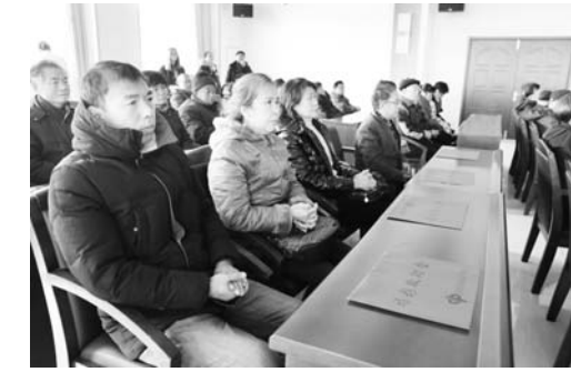
△困难劳模每人领取2000元福彩公益金

为切实把福彩公益金“取之于民、用之于民”的原则落到实处，此次救助金发放对象严格按照以下标准筛选：家庭收入低于当地城镇居民最低生活保障线的市级劳模；月工资收入低于最低工资标准的在岗市级劳模；与企业解除劳动关系或失业后生活困难的市级劳模；由劳模本人抚养或赡养的直系亲属因就学、患重病和遭受意外灾害等造成家庭