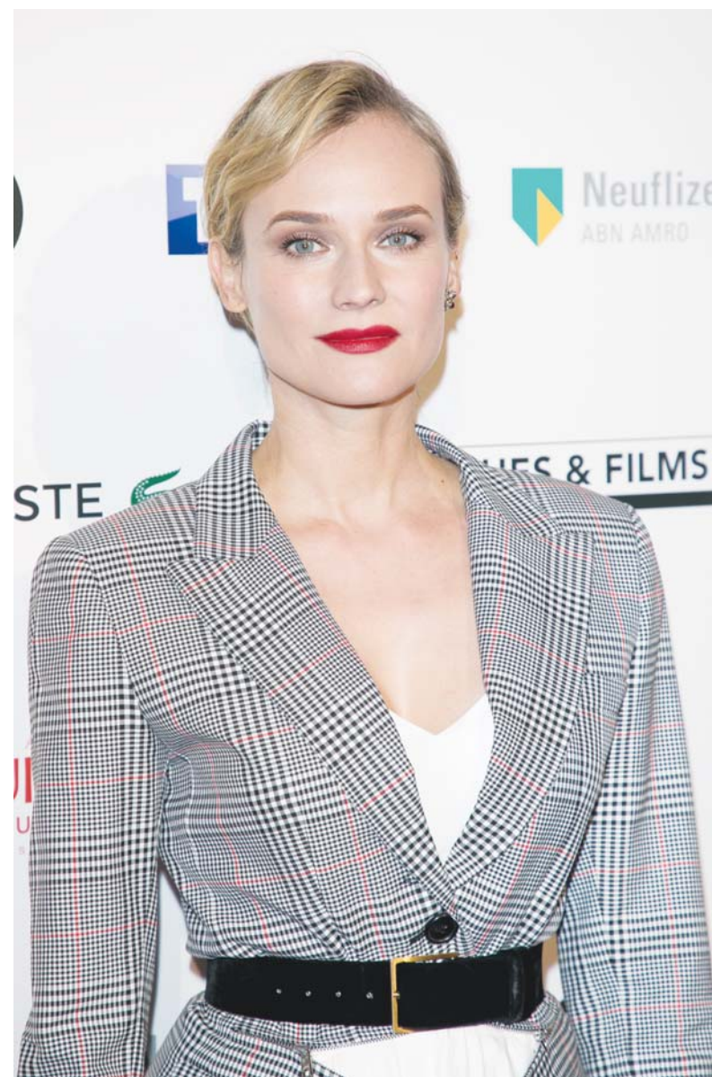
当地时间2月6日,巴黎,黛安·克鲁格亮相电影推广活动。

此外,以大国、小家、好梦圆为创意原点的江苏卫视春晚将于2月17日大年初二与观众见面。