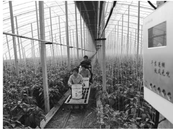
□陈彬 报道 日前,在博兴县店子镇大杨村的9个智能蔬菜大棚里,农民们正忙着使用高科技管理蔬菜。这9个智能大棚每个占地12亩,使用手机就可以进行远程控制,并能够自动进行控温、放风和排湿,同时还配备了水肥一体机,使浇水、施肥也实现了自动化。

管方式,在大型企业推行良好生产规范、危害因素关键控制点(HACCP)体系和食品安全受权人制度,全面落实企业食品安全自查制度;加强药品供应链监管,鼓励药品现代物流企业承接药品储存配送业务,探索发展社会化药品第三方物流;完善医疗器械监管风险交流、信息传递和检查员管理等制度建设,探索区域交叉检查机制;健全食品药品追溯管理制度,压实企业主体责任,督促和指导企业依法建立质量安全追溯体系。