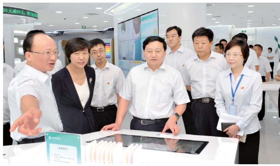
△农行山东省分行坚持“客户至上 始终如一”服务理念,努力提升客户体验

助力新兴业态发展,为动能转换“加速度”。十九大报告提出,要推进绿色发展,加快生态文明体制改革。绿色发展是工业转型升级的必由之路,农行山东省分行认真贯彻落实国家绿色发展理念,不断提升绿色金融管理水平,以新一代信息技术、新能源汽车、生物技术、新材料等战略性新兴产业为重点,支持产业结构调整,建立覆盖全产业链的绿色金融产品体系,系统化地支持绿色产业的布局和发展。该行不断加强与支持客户的合作,合作领域从风电产业扩大到光伏发电、核电发电、燃煤锅炉节能改造等产业,促进绿色信贷可持续发展。注入“金融活水”,助力“老树开花”。近年来,泰山石膏有限公司依靠生产技术创新、管理创新,取得了丰硕成果,一举突破“年产5000万平方米大型纸面石膏板生产线关键技术”,并获得“国家建筑材料科技进步一