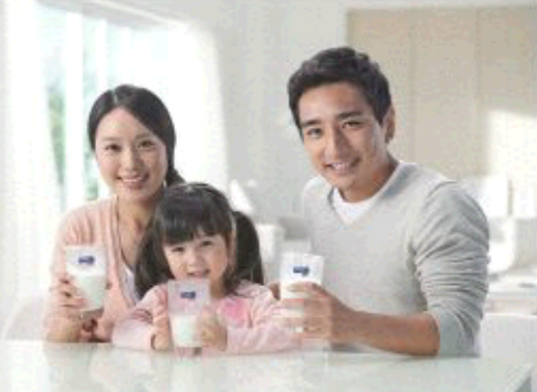
△新鲜优质的得益乳品深受消费者青睐