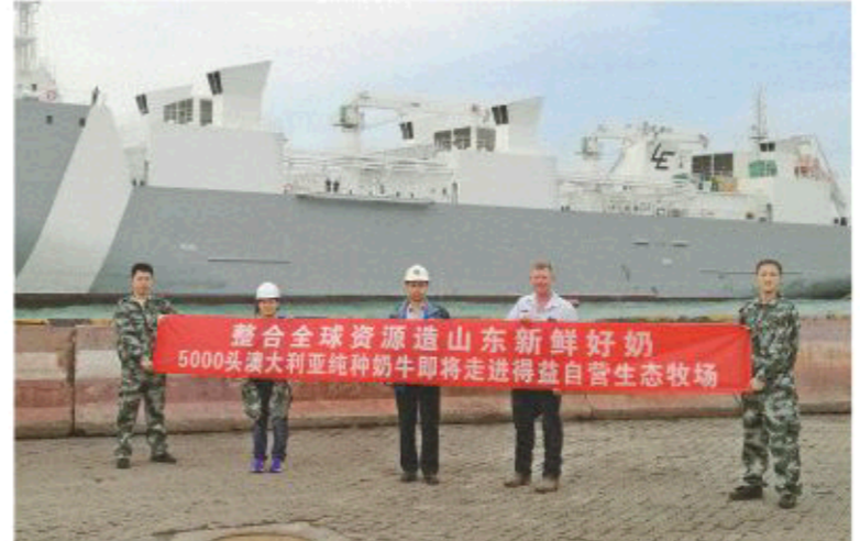
△澳洲纯种奶牛走进得益自营生态牧场

企业竞争的核心是产品,产品的核心是技术,只有技术领先才是真正的领先。得益乳业积极践行中国优质乳工程,坚持以国际化标准指导产品研发,巨资引进澳洲纯种荷兰奶牛,