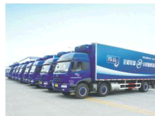
△全程冷链运输一路“领鲜”

得益乳业为更好满足客户需求,现已实施千店工程、万家网点工程。目前建成社区、商超、代理流通、直营零售、连锁、特通、团购、电商八大渠道,覆盖大型商超580余家、三星级以上酒店140多个、零售网点数千个、便利店连锁店1000多家,建设投建站165个,社区服务店5000多个,并拥有2000余人的送奶服务队伍。实现了新鲜产品最后一公里配送,让新鲜优质的产品与消费者零距离。 每一天都有专业的送奶员将新鲜的产品送到客户家中,保证产品从出厂到餐桌24小时新鲜到家服务,实现了服务与消费者零距离。销售服务网点遍布山东全省绝大部分区域,辐射北京、河北、河南、安徽、江苏等省市,形成了送奶服务和终端销售齐头并进、互相促进的渠道战略,渠道通路的完善也使得消费者可以非常方便地买到得益产品。 伴随着世界经济“创新、活力、联动、包容”的发展趋势,中国乳业“引进来”和“走出去”的步伐逐渐加快,全球乳业“一体化”不断加速,得益乳业必将紧随“一带一路”建设的脚步,深度融入世界乳业,不断增强中国乳业的话语权,为中国乳业融入全球乳业的发展贡献一份力量。