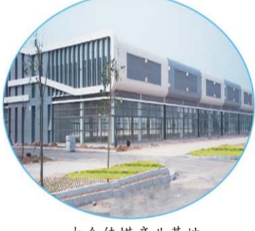
大众传媒产业基地

山东大众报业集团大众传媒产业基地、山东石方机械再制造项目、济南沃德新生产线项目等省、市、区重点工程，多项工程获得各级安全文明优秀工地称号，累计已完成各类钢结构工程达40余万平方米，工程业绩涵盖多层钢结构建筑、轻钢结构、网架结构、相关桁架结构、拱形金属屋面结构，工程涉及物流市场、仓储、冶金、食品等行业。