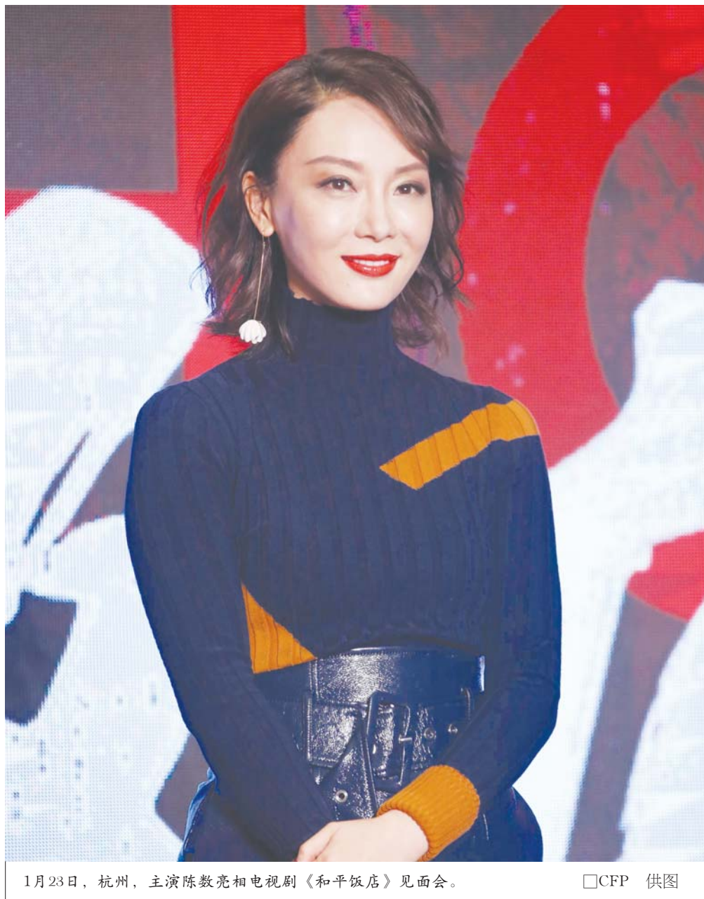
1月23日,杭州,主演陈数亮相电视剧《和平饭店》见面会。