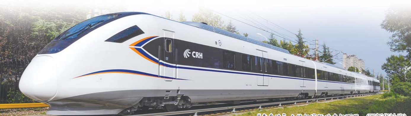
“青鸟造”小编组城际动车组下线。