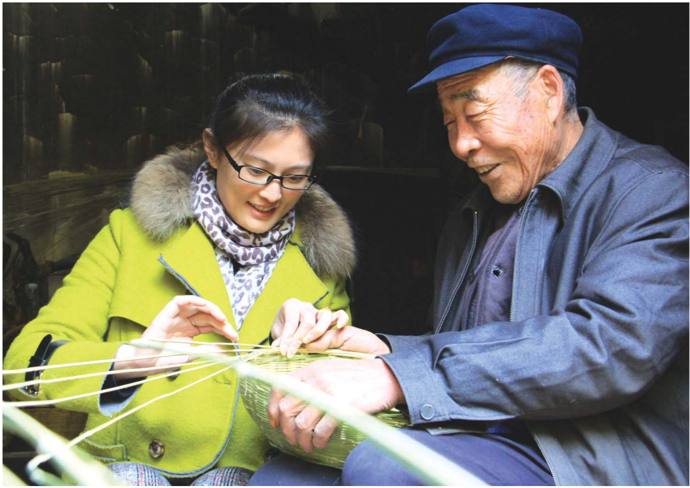
▲近日，沂南县竹泉村景区内，游客在村民的指导下自己动手做手工艺品。

于风贵表示，要打造高端品牌，推动优质旅游发展。无论是推进旅游的高质量发展，还是发展优质旅游、精品旅游，最终都要体现在品牌高端化上，扩大品牌的知名度和游客对品牌的信赖度、忠诚度。