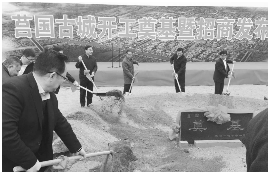
投资44亿元的莒国古城项目奠基仪式现场。