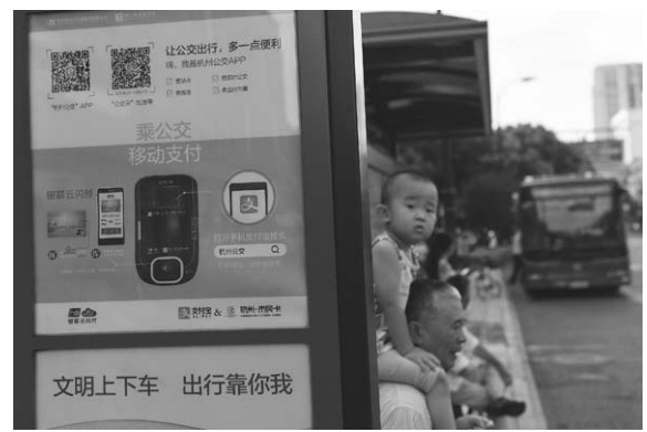
在杭州一处公交站,使用移动支付乘坐公交车的宣传广告(7月20日摄)。

新华社北京12月27日电 国台办发言人安峰山27日在例行新闻发布会上应询表示,据了解,目前大陆有关部门已核发269万本卡式台胞证。下一步,大陆方面会认真研究改进在依托电子和网络技术提供服务时无法识别台胞证的问题,为广大台湾同胞提供更多便利。安峰山指出,台湾同胞对卡式台胞证在功能性和便利性方面的极大提升普遍给予积极评价,要求申领和换领卡式台胞证的人数越来越多。