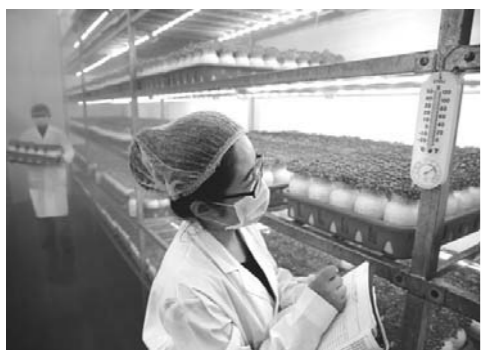
□ 记者 卢鹏 通讯员 周广学 报道 12月8日，利津县明集乡利农菌业公司高科技食用菌培植车间里，工人正在查看、记录蟹味菇的生长情况。

对经省级公安机关出入境管理机构备案的企业邀请前来实习的境外高校外国学生，可在入境口岸申请短期私人事务签证入境进行实习活动；持其他种类签证入境的，也可在境内申请变更为短期私人事务签证进行实习活动。（据新华社）