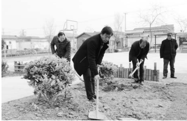
□张环泽 刘凤琦 报道

为打赢蓝天保卫战,做好大气污染防治,宁津着力抑制道路工地扬尘,加强环境执法。住建、城管执法部门多种方式采取GPS车辆定位、数字城管监控、队员昼夜巡查等多种方式对道路工地扬尘进行严格的管理,围绕施工现场围挡、道路硬化、渣土物料覆盖等58项内容,对扬尘防治标准进行全面细化,要求建筑单位全部依规范施工,杜绝违规作业制造扬尘。据悉,今年该县已处理因制造扬尘造成大气污染等行为的案件16起。