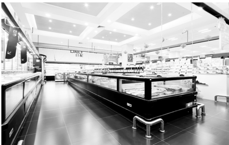
△海尔开利岛柜服务于青岛佳世客超市

紧随着准人的改革，是准入过程中大刀阔斧的自我革命。由改革前的各部门分别管理企业准入事项，变为“单一窗口”，打破了部门信息孤岛，减少了自由裁量权。自2014年起，我省有步骤地推广企业业务受理“单一窗口”模式，深化行政审批制度改革，全面实施注册资本认缴